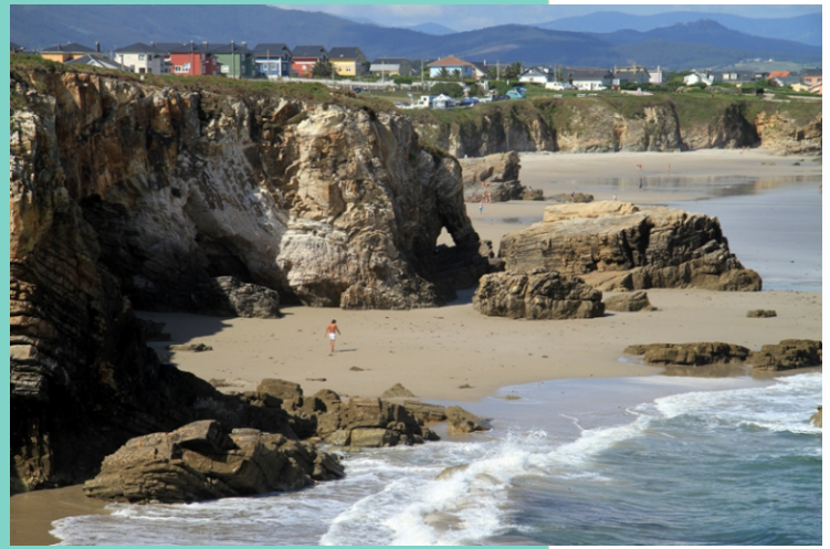
8-Praia de San Pedro de Lóngara (Benquerencia)