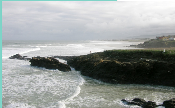
6-Punta de San Bartolo