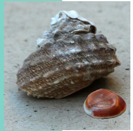
11-Punta do Castro

Hai unha tradición en Reinante que dí que ao que atopa na praia un "bítere", o opérculo dunha caracola ( Bolma rugosa ) en perigo de extinción, procedente de augas profundas, terá un ano de boa sorte e amor.