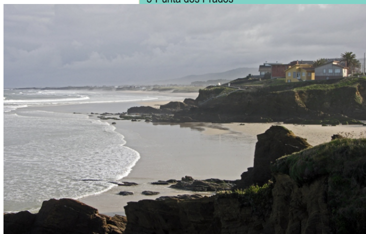
Praia de San Bartolo