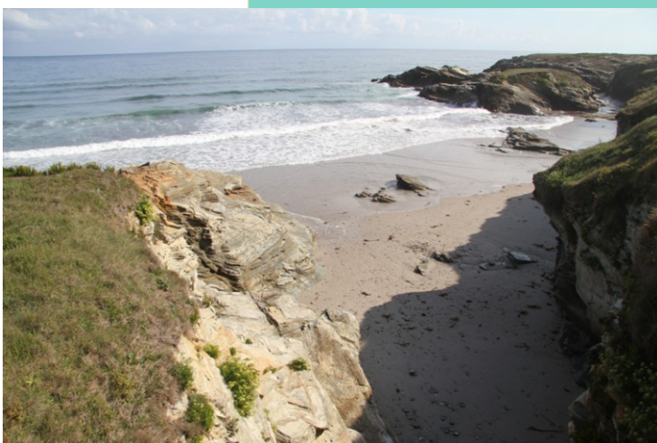
Praia Moledo (Reinante)

12-Praia de Arealonga, e Punta do Castro (Reinante). Mide 950 m de lonxitude e 20 m de largor medio. Todos os veráns se celebra nesta localidade un nomeado concurso internacional de castelos de area.