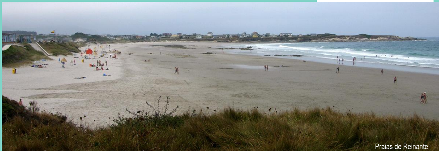
Praias de Reinante

Un tramo da costa está protexido nos LICs “As Catedrais” e “Foz-Masma”. A ría e o esteiro están declaradas ZONA ESPECIAL DE PROTECCIÓN PARA AS AVES (ZEPA) e o esteiro está incluído no Inventario de ÁREAS IMPORTANTES PARA AS AVES da Sociedade Española de Ornitología (SEO/BirdLife).