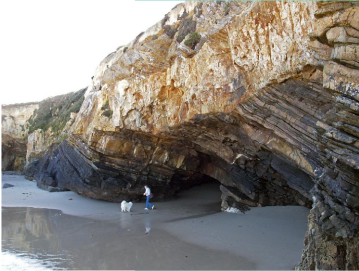
Furna na praia de San Pedro de Lóngara. Esta praia é un interesante museo xeolóxico onde podemos atopar furnas, arcos e dobras.