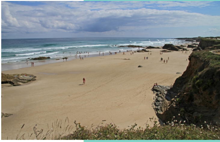
8-Praia de Fontela (Benquerencia)