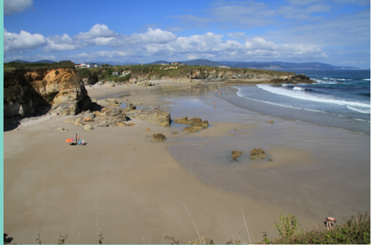
9-Punta Corveira. nesta punta comeza o LIC/ZEC "Praia das Catedrais"