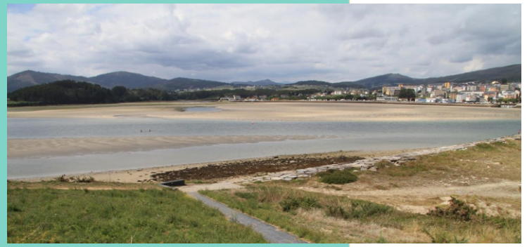
2-Punta e praia da Angueira. Vista cara ao interior da ría (esquerda) e á boca da ría, con Foz ao fondo (arriba).