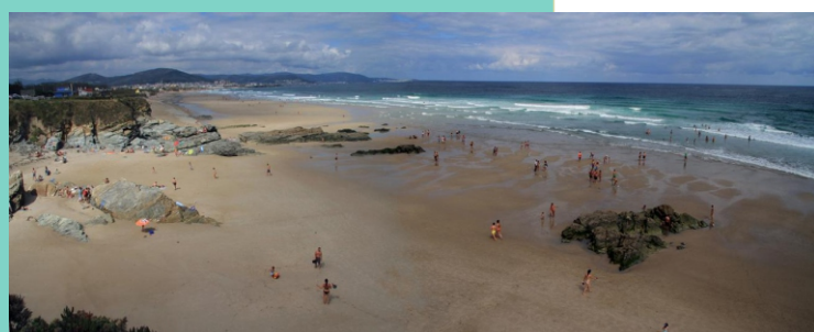
7-Praia de Pena da Salsa (San Cosme de Barreiros)