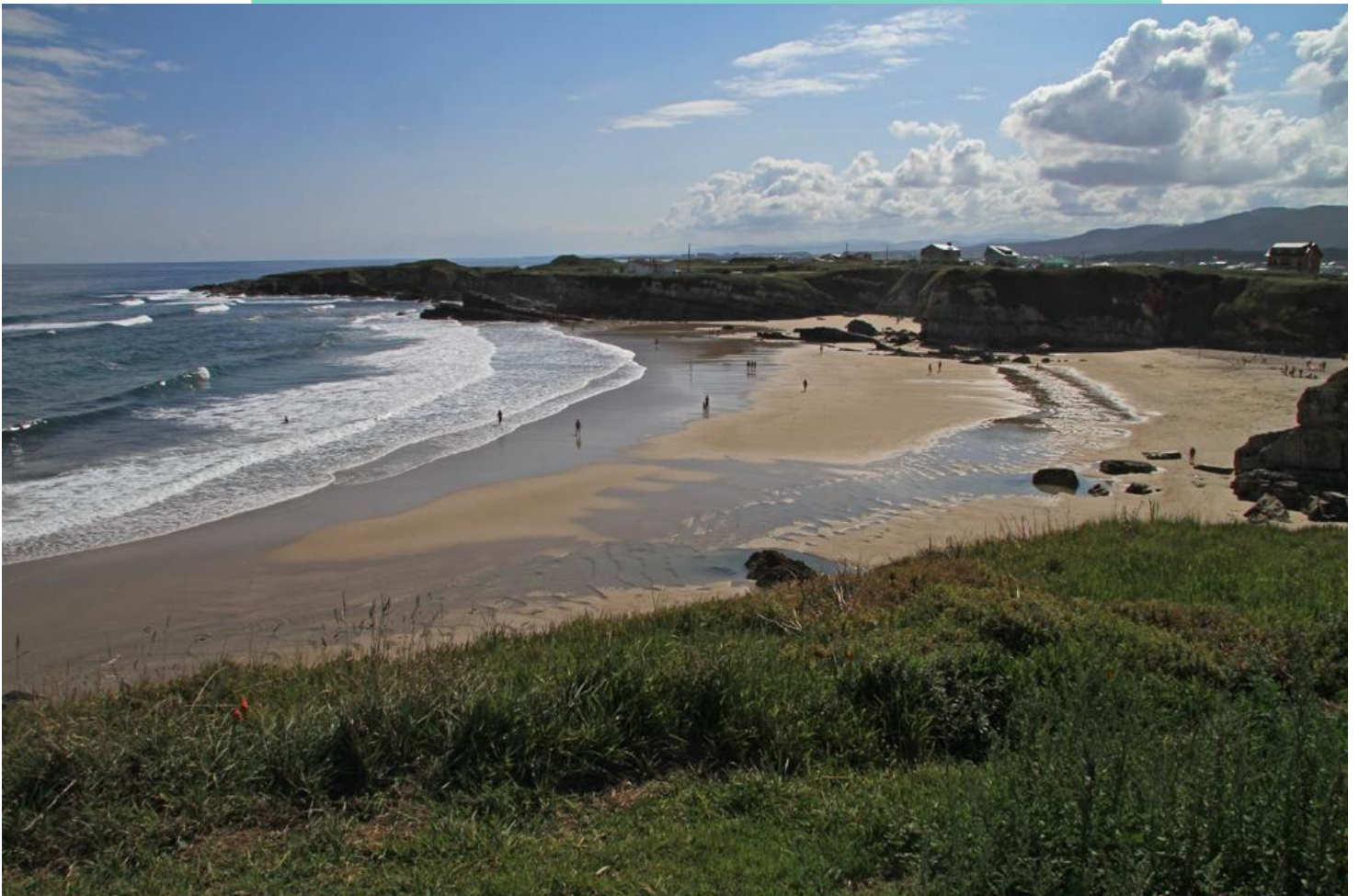
10-Praia da Pasada ou do Castro