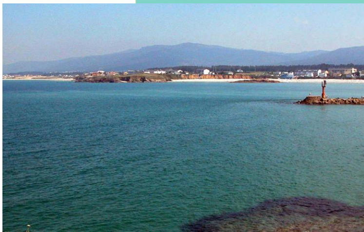
5-Punta dos Prados