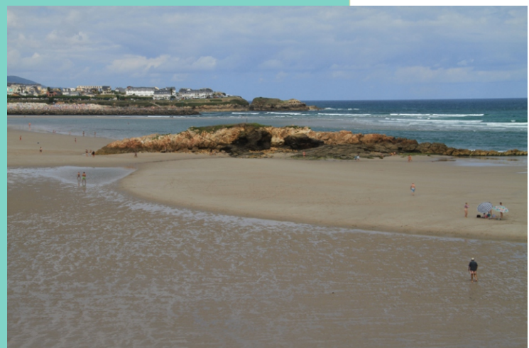
4-Pedra de Altar (Pedra Rubia)

Na parte externa da ría de Foz atópase unha frecha de area que tapa parcialmente a súa boca (entre as praias de Altar e Angueira, resultado da interacción entre a dinámica interna da ría e unha corrente O-E que percorre a costa. Entre os anos 1969 e 1977 construíronse en Foz unha serie de espigóns que modificarón a dinámica da ría e fixeron practicamente desaparecer esta frecha arredor de 1980, mentres se xuntaba area na outra banda, na praia da Rapadoira. Na actualidade estase a rexenerar, despois da construción dun novo dique en 1988.