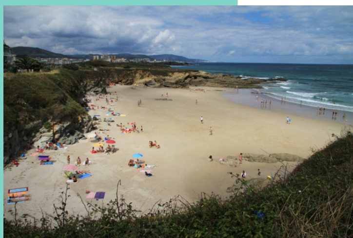
7-Praia de Remior (San Cosme de Barreiros), de 800 m de lonxitude.