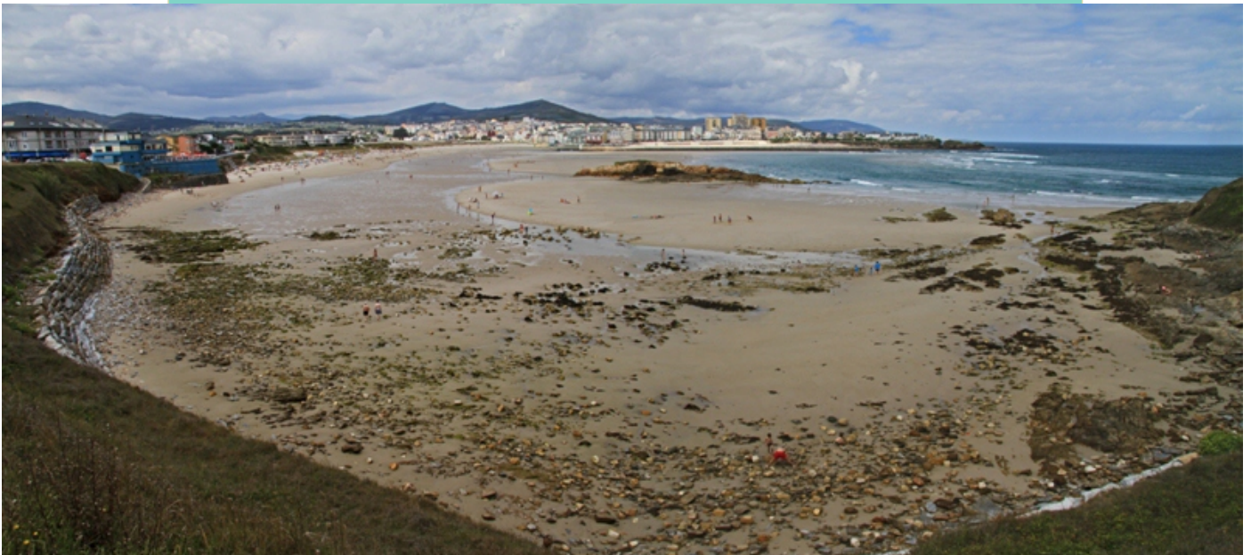
3-Praia de Altar, de 950 m de lonxitude e 45 m de largor medio. O nome ven da tradición que conta que se celebraban sacrificios na pedra do Altar.

Na parte externa da ría de Foz atópase unha frecha de area que tapa parcialmente a súa boca (entre as praias de Altar e Angueira, resultado da interacción entre a dinámica interna da ría e unha corrente O-E que percorre a costa. Entre os anos 1969 e 1977 construíronse en Foz unha serie de espigóns que modificarón a dinámica da ría e fixeron practicamente desaparecer esta frecha arredor de 1980, mentres se xuntaba area na outra banda, na praia da Rapadoira. Na actualidade estase a rexenerar, despois da construción dun novo dique en 1988.