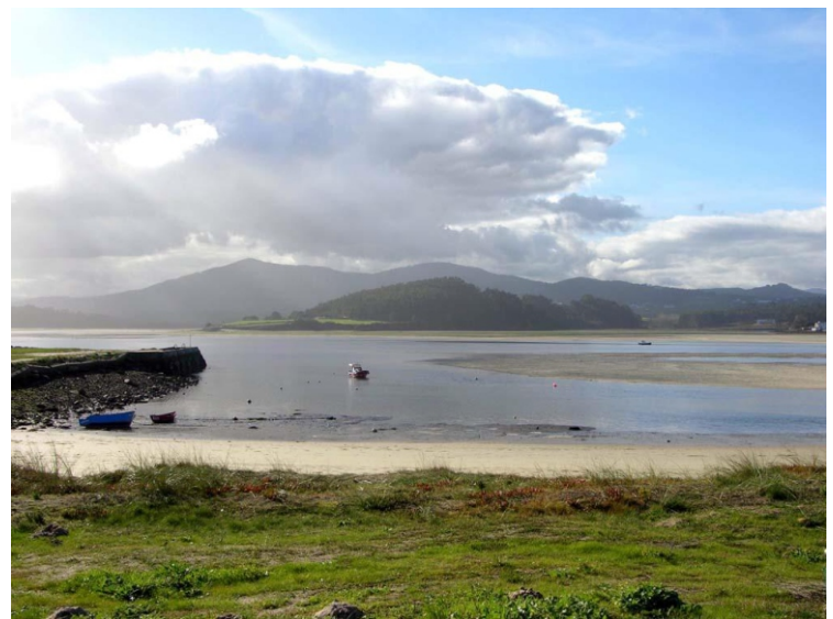
Esteiro do Masma e ría de Foz desde a praia da Angueira.

Accolle unhas 200 especies de aves, especialmente aves acuáticas invernantes.